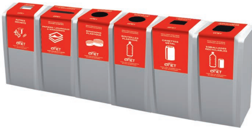
Illustration de mise en œuvre sur le Siège ONET