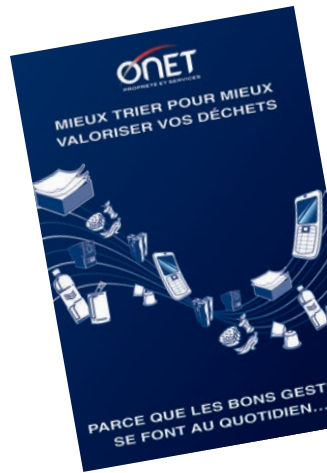
Exemples de supports de communication

Objectif 2017 75% de valorisation des déchets sur le siège d'ONET